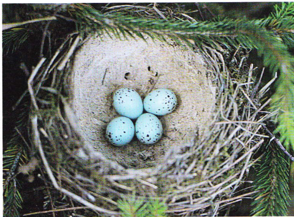
Cova di Tordo Intacco nel nido